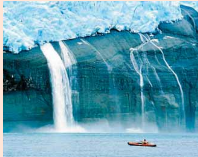
El desgel causat per l'efecte hivernacle, a Groenlàndia.